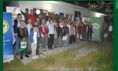
29.04.2019 tarihinde Muğla İlinin Milas İlçesindeki Balcılar Mahallesi'nde 62 üreticiye “Sağım Uygulamaları Eğitimi”