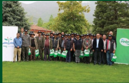
26.04.2019 tarihinde İzmir İlinin Ödemiş İlçesindeki Bademli Mahallesi'nde 31 üreticiye “Hayvan Sağlığı Eğitimi”