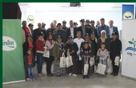
17.04.2019 tarihinde Aydın İlinin Bozdoğan İlçesindeki Amasya Mahallesi'nde 24 üreticiye “Sağım Uygulamaları Eğitimi”