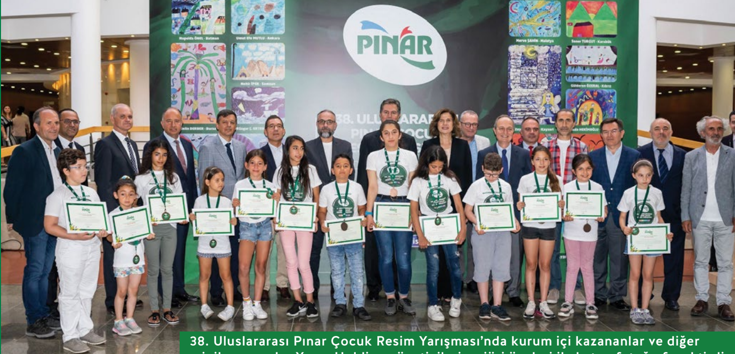
38. Uluslararası Pınar Çocuk Resim Yarışması'nda kurum içi kazananlar ve diğer minik ressamlar Yaşar Holding yöneticileri ve jüri üyeleri ile hatıra fotoğrafı çekti.

38. Uluslararası Pınar Çocuk Resim Yarışması'nda dereceye giren minikler 20 Haziran tarihinde gerçekleştirilen Ödül Töreni'nde bir araya geldi.