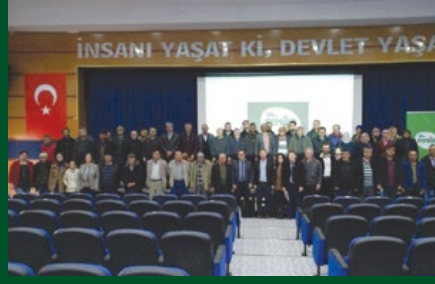
11.04.2019 tarihinde Bilecik ilinin Pazaryeri İlçesindeki Pazaryeri Belediyesi konferans salonunda 106 üreticiye “Hayvan Sağlığı Eğitimi”