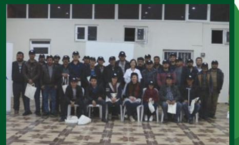
18.04.2019 tarihinde Aydın İlinin Bozdoğan İlçesindeki Kavaklı Mahallesi'nde 30 üreticiye “Sağım Uygulamaları Eğitimi”