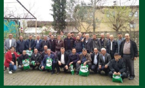
12.04.2019 tarihinde Bursa ilinin Yenişehir ilçesi Osmaniye ve Çiçekközü köylerinde 45 üreticiye “Hayvan Sağlığı Eğitimi”