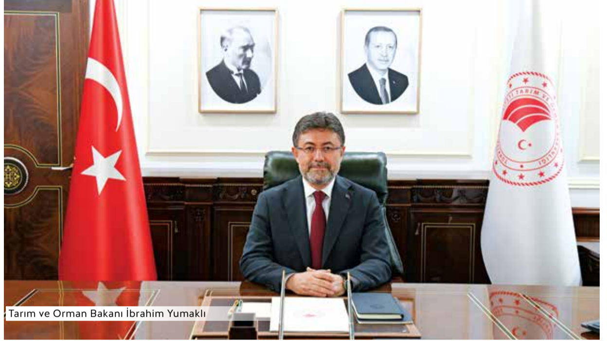
Tarım ve Orman Bakanı İbrahim Yumaklı

Yeni destekleme modeli ile hayvancılık yapan kadın ve gençler için ilk kez ilave destek uygulanacak. Verimliliği artırıcı kriterleri sağlayan üreticiler desteklerden daha fazla yararlanacak. Geçmiş yıllarda destekleme kararnamesinde yer alan hayvancılık desteklerinden bazıları yeni modelde yer verilmeyerek kaldırıldı. Hayvancılıkta kaldırılan destekler arasında; yem bitkileri desteği (bu bitkisel üretim destekleri içinde yer alabilir), hayvan başına destek, dişi manda desteği,