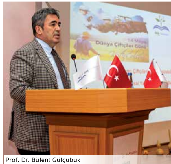
Prof. Dr. Bülent Gülçubuk

Aile çiftçiliğinin tarımın ve kırsal yaşamın temel yapı taşlarından olduğunun altını çizen Gülçubuk, "Bu ülkemiz için de böyledir, dünya için de. Aile çiftçiliği gerçek bir üretim faaliyetidir; hayata tutunma yolu ve iş kapısıdır. Tüm dünyada yaklaşık 570 milyon tarımsal işletmenin yaklaşık %90'ı aile içi emeğe