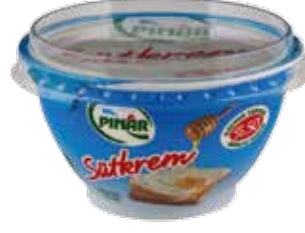
Süt krem 160 gr.