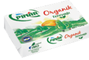
Organik Tereyağı 150 gr.