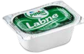
Labne 20 gr.