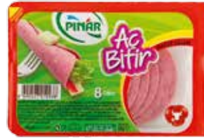
Salam Aç Bitir Macar 60 gr.