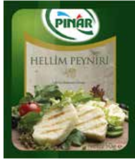
Hellim Peyniri 250 gr.