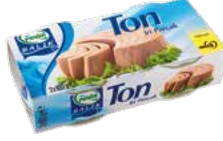
Ton Balık 160 gr.*2