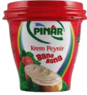
Krem Peynir 400 gr.