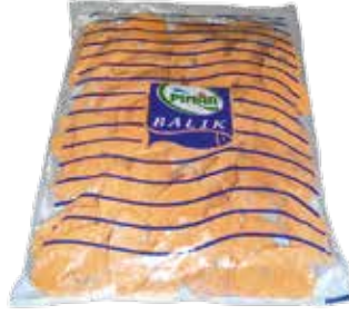
Sardalya Fileto Pane 2.500 gr.