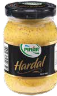
Hardal 175 gr.