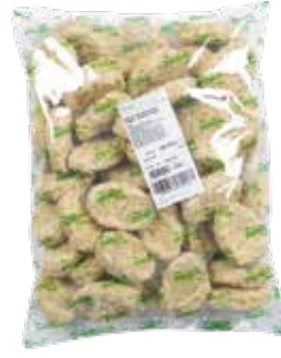
Köfte Kadınbudu Servis 2.500 gr.