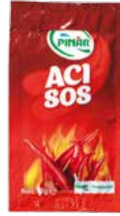
Acı Sos 10 gr.