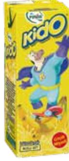
Kido Muzlu Süt 1/5 lt.