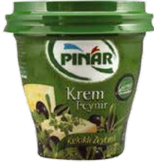
Krem Peynir Kekik - Zeyt. Gurme 300 gr.