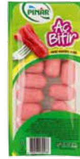
Sosis Aç Bitir Kokteyl 170 gr.