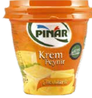
Krem Peynir Cheddarlı Gurme 300 gr.