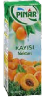
Meyve Nektarı Kayısı 1/5 lt.