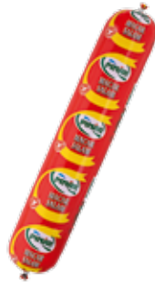
Salam Macar 1.250 gr.