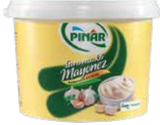
Sarımsaklı Mayonez 2.250 gr.