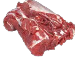
Dana Parça Et