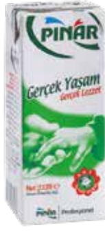
Yağlı Süt EDT 1/5 lt.