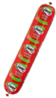
Salam Fıstıklı 1.250 gr.