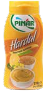
Hardal Plastik 270 gr.