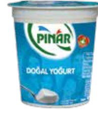
Yoğurt Yarım Yağlı 150 gr.