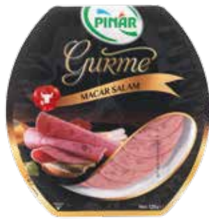
Salam Macar Gurme 120 gr.