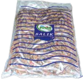
Hamsi Temizlenmiş 2.500 gr.