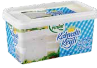
Beyaz Peynir Slm. Khv. Kyf. 800 gr.