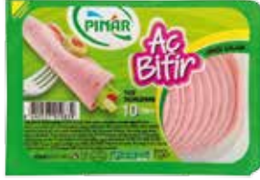
Salam Aç Bitir 75 gr.