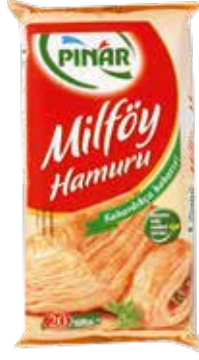
Milföy 1.000 gr.