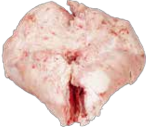
Kuzu Kuyruk Yağı