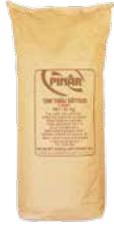
Süt Tozu Tam Yağlı 25 kg.