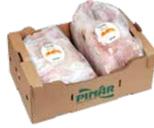
Hindi D. Mar. Bütün (Erkek)