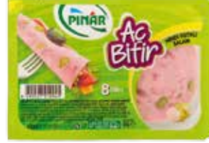
Salam Aç Bitir Fıstıklı 60 gr.