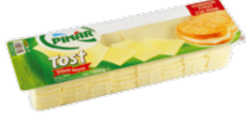
Dilimli Tost Peyniri 1.600 gr.