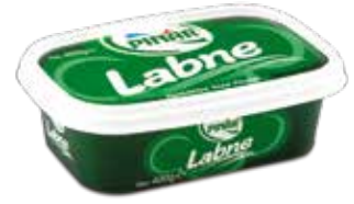
Labne 400 gr.