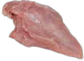
Hindi D. Fileto Derisiz