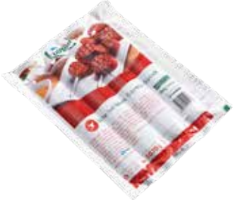
Sucuk Büfe 1.070 gr.