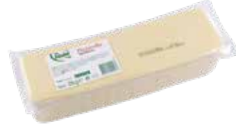
Pizzarella 2.000 gr.