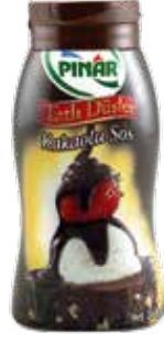
Kakaolu Sos 350 gr.