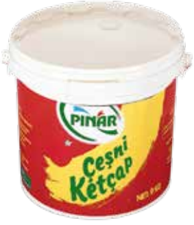
Ketçap 9.000 gr.