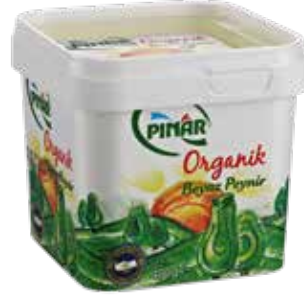
Beyaz Peynir Organik 400 gr.