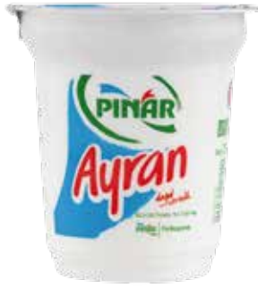
Ayran EDT 300 ml.