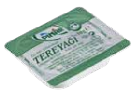
Tereyađı 10 gr.