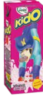
Kido Çilekli Süt 1/5 lt.