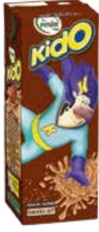
Kido Kakaolu Süt 1/5 lt.