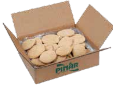
Piliç Pane Servis 104 gr.