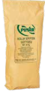
Süt Tozu Kolay Eriyen 20 kg.