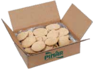
Piliç Pane Servis 77 gr.