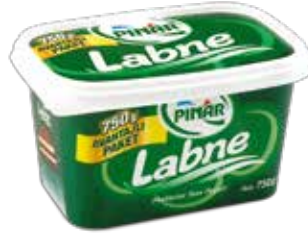
Labne 750 gr.