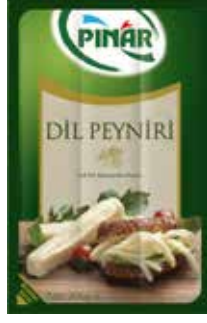
Dil Peyniri 200 gr.