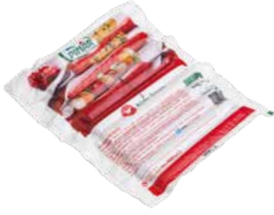
Sosis Büfe 460 gr.