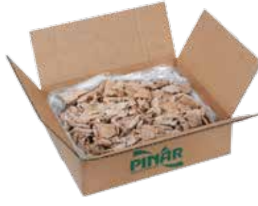
Döner Büfe 5 kg.