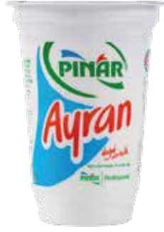
Ayran EDT 180 ml.