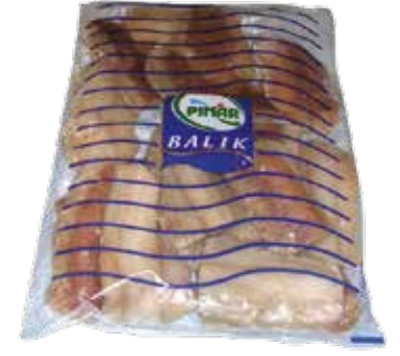
Mezgit Fileto Derisiz (140-170) 2.500 gr.