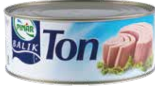
Ton Balık 1.000 gr.