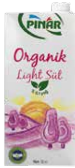
Süt Organik Light (0.1 Yağ) 1/1 Lt.