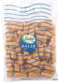
Balık Çıtır 2.500 gr.