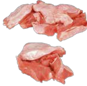
Hindi D. Parça Et