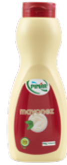
Mayonez Servis 700 gr.