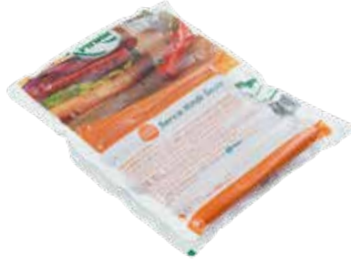
Sosis Servis 460 gr.