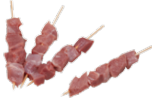
Hindi D. Mar. Fileto Çöp Şiş