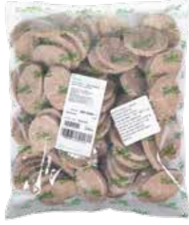
Köfte Izgara Büfe 2.250 gr.