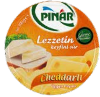
Üçgen Peynir Cheddarlı 12.5 gr.