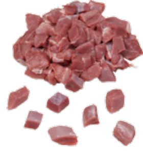
Hindi D. Mar. But Kuşbaşı