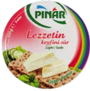
Üçgen Peynir Light 12.5 gr.