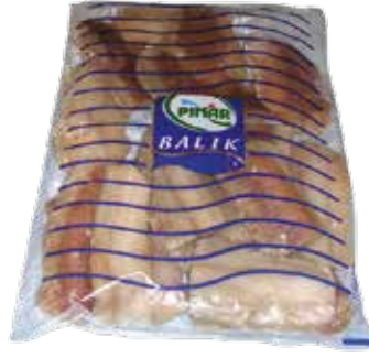
Mezgit Fileto Derisiz (80-120) 2.500 gr.