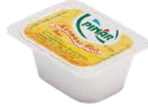
Bal 20 gr.