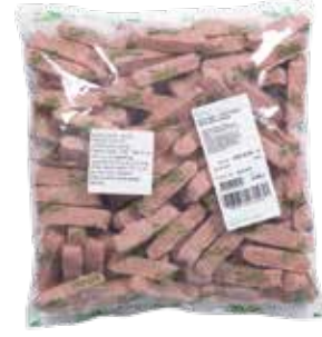
Köfte İnegöl Büfe 2.000 gr.