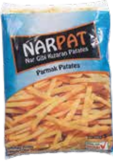
Patates Narpap Cat. (9x9)(5x2,5 kg.) 2.500 gr.