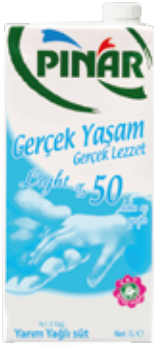
Light Süt (%50 Az Yağ) 1/1 lt.