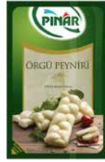
Örgü Peyniri 200 gr.