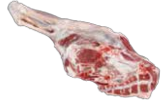
Kuzu But Sıyrma