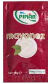
Mayonez Poşet 10 gr.