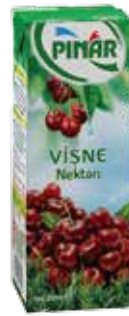
Meyve Nektarı Vişne 1/5 lt.