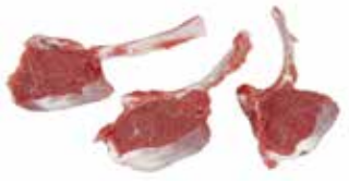
Kuzu Pirzola Kalem