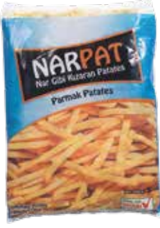
Patates Narpap (9x9)(5 X 2,5 kg.) 2.500 gr.