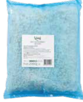
Mozzarella Küp 2.000 gr.