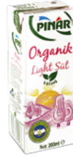
Süt Organik Light (0.1 Yağ) 1/5 Lt.