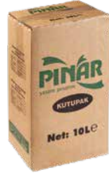
Kutupak Y.Yağlı Süt 10 kg.