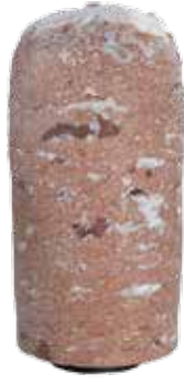
Döner Büfe 20 Kg.