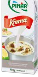
Krema Edt 1/1 lt.