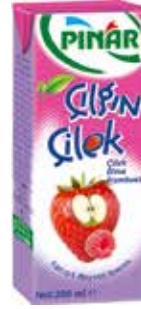
Çılgın Çilek Elma Frambuaz 1/5 lt.