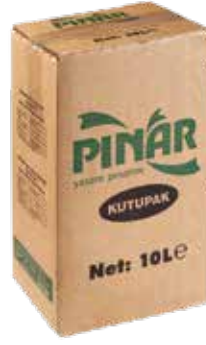
Kutupak Süt 10 kg.