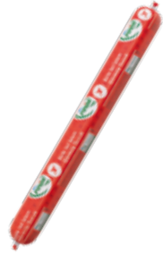
Sucuk Büfe 500 gr.