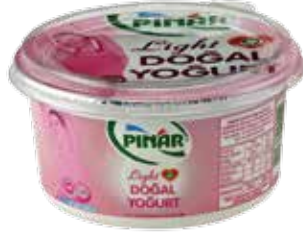
Yoğurt Extra Light 900 gr.