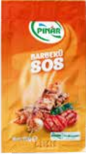
Barbekü Sos 10 gr.