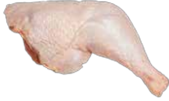
Hindi D. Mar. But Derili