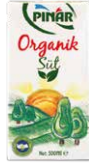
Süt Organik 1/2 Lt.