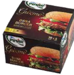
Burger Gurme 450 gr.