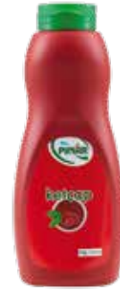
Ketçap Servis 800 gr.