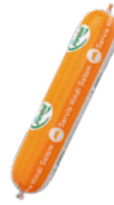
Salam Servis 900 gr.