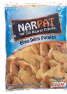
Patates Narpap Sossuz Elma Dil. (5x2,5 kg.) 2.500 gr.