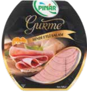
Salam Hindi Gurme 120 gr.