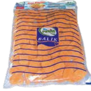
Mezgit Fileto Pane 2.500 gr.