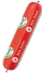
Salam Büfe 900 gr.