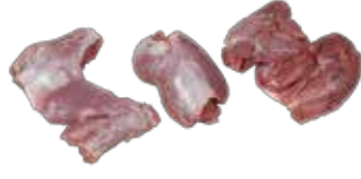
Hindi D. Mar. Üstbut K.siz Derisiz