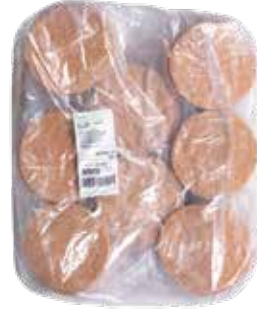
Burger Büfe 90 gr.