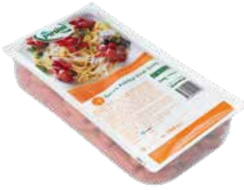
Sosis Kokteyl Servis 2.500 gr.