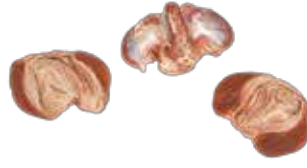
Hindi D. Taşlık