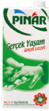
Tam Yağlı Süt 1/1 lt.