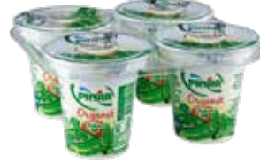
Organik Yoğurt 400 gr.