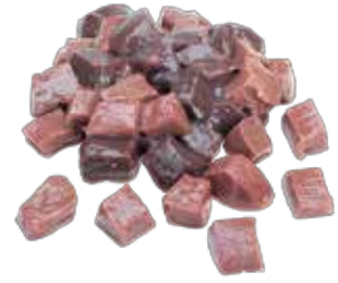
Dana Cat. Karaciğer Kuşbaşı