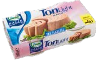
Ton Balık Light 160 gr.*2