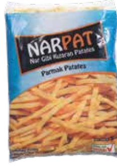
Patates Narpap Eko. (9x9)(5x2,5 kg.) 2.500 gr.