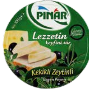
Üçgen Peynir Kekikli Zeyt. 12.5 gr.