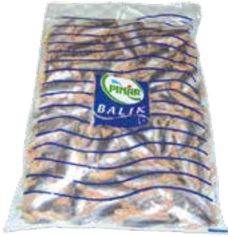
Sardalya Fileto 1 kg.