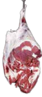
Dana But Kemiksiz (Kısa)