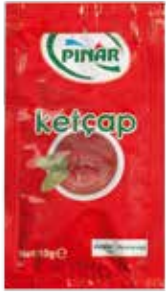
Ketçap Poşet 10 gr.