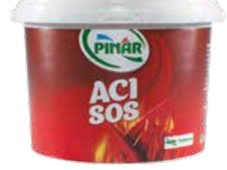
Acı Sos 2.250 gr.