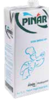
Yarım Yağlı Süt EDT 1/1 lt.