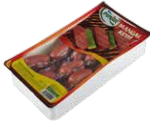
Sucuk Mangal 2.000 gr.