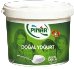
Yoğurt 9.000 gr.