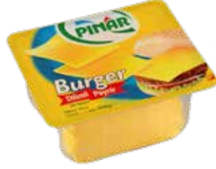
Burger Peynir Dilimli 350 gr.