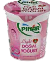
Yoğurt Extra Light 200 gr.