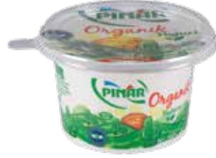
Organik Yoğurt 1000 gr.