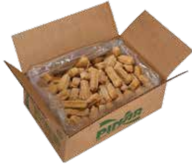
Piliç Krokot Servis 1.000 gr.