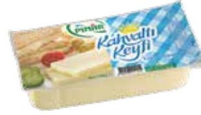
Taze Kaşar Khv. Kyf. 700 gr.