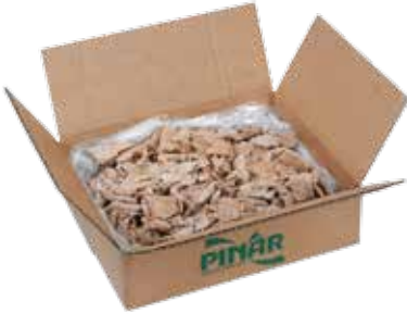
Döner Servis 5 kg.