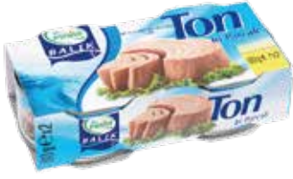
Ton Balık 80 gr.*2