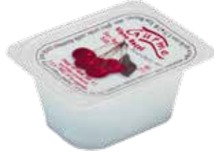
Reçel Vişne 20 gr.