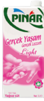
Light Süt (0.1 Yağ) 1/1 lt.