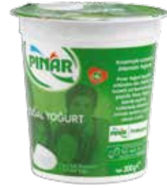
Yoğurt EDT 200 gr.