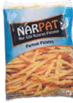
Patates Narpap (6x6)(5x2,5 kg.) 2.500 gr.