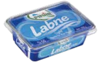
Labne Light 200 gr.