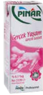
Yağsız Süt EDT 1/5 lt.