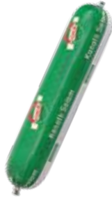
Salam Yörük Catering 900 gr.