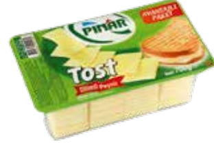
Dilimli Tost Peyniri 700 gr.