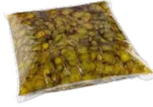
Turşu Dilimli 5.000 gr.