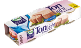
Ton Balık Light 80 gr.*3