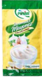
Sarımsaklı Mayonez 10 gr.