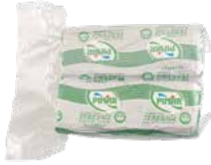
Tereyađı (2x1kg.) 2.000 gr.