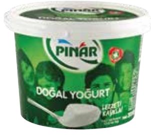
Yoğurt 2.000 gr.