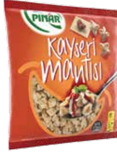
Kayseri Mantısı 400 gr.