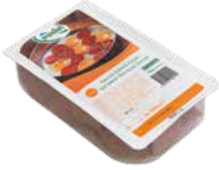
Sucuk Dilimli Servis 500 gr.