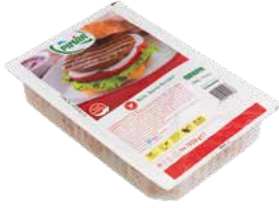
Burger Büfe 45 gr.