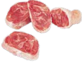
Hindi D. Mar. But Fırınlık