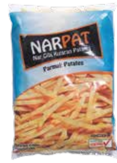
Patates Narpap (9x9)(10x1 kg.) 1.000 gr.