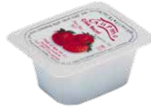
Reçel Çilek 20 gr.