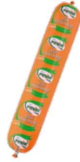
Salam Hindi Fıstıklı 1.250 gr.