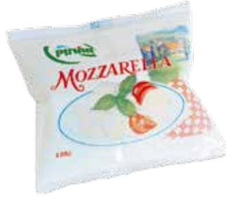
Mozzarella Suda 125 gr.