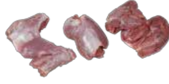
Hindi D. Üst But K.Siz Derisiz