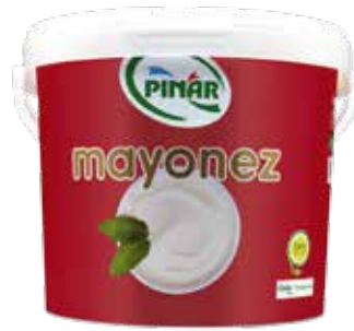
Mayonez Servis Kova 8.000 gr.