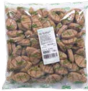
Köfte Pişmiş Servis 1.750 gr.