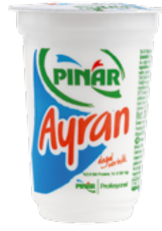
Ayran EDT 200 ml.