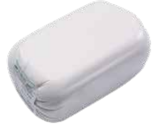
Jambon Yörük Catering