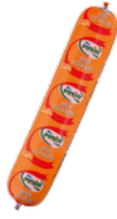
Salam Hindi Etili 1.250 gr.