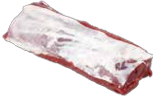
Dana Mar. Kontrfile