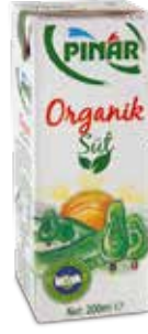
Süt Organik 1/5 Lt.