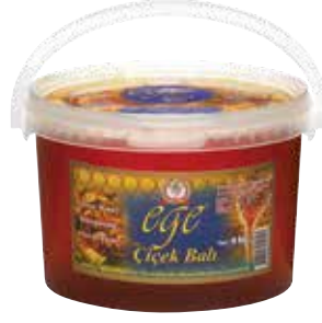
Ege Çiçek Balı Kova 4.000 gr.