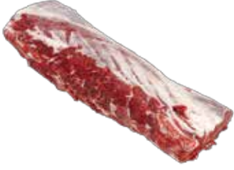
Dana Mar. Antrikot