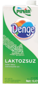
Denge Laktosuz Süt 1/1 lt.