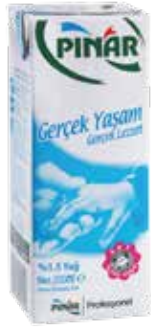
Yarım Yağlı Süt EDT 1/5 lt.