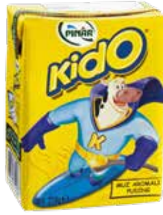
Muzlu Puding 200 gr.