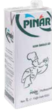
Yağlı Süt EDT 1/1 lt.