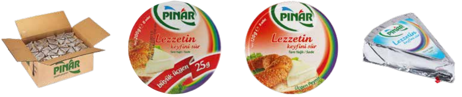
Üçgen Peynir EDT Y.Y. 12.5 gr.