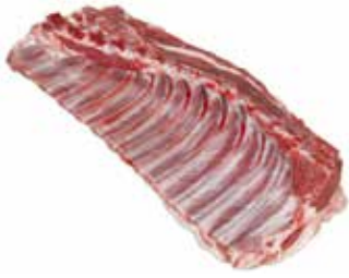
Kuzu Pirzola Kanat