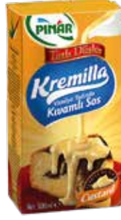
Kremilla Kıvamlı Sos 500 gr.