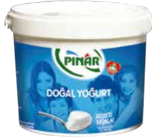
Yoğurt Yarım Yağlı 9.000 gr.