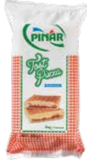
Tost Pizza 260 gr.