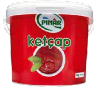
Ketçap Servis Kova 9.000 gr.