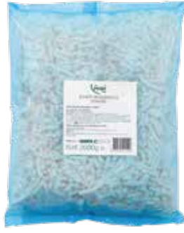
Mozzarella Rende 2.000 gr.