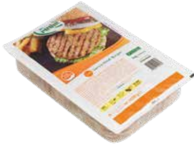
Burger Servis 45 gr.