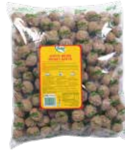
Köfte Misket Servis 2.500 gr.