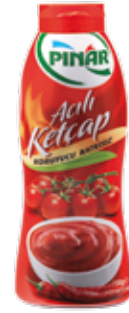
Ketçap Acılı 750 gr.