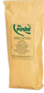
Süt Tozu Yağsız 25 kg.