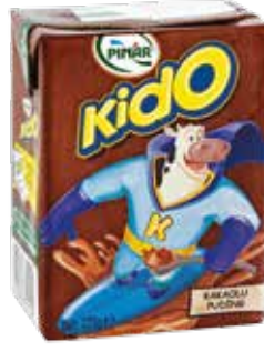
Kakaolu Puding 200 gr.