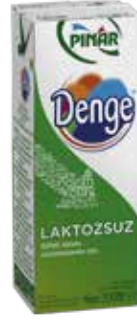
Denge Laktosuz Süt 1/5 lt.