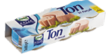
Ton Balık 80 gr.*3