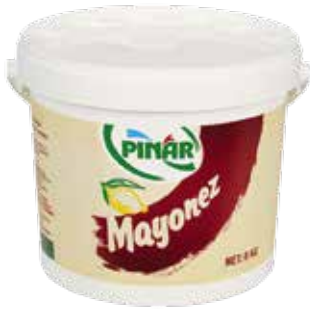
Mayonez 8.000 gr.