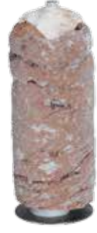
Döner Büfe 6 kg. Blok