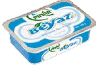
Pınar Beyaz 200 gr.