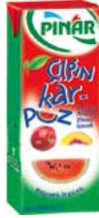
Çılgın Karpuz 1/5 lt.