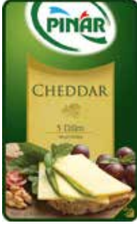
Cheddar Dilimli 200 gr.