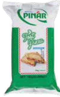
Tost Pizza 300 gr.