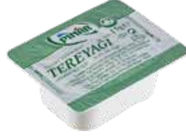
Tereyađı 15 gr.