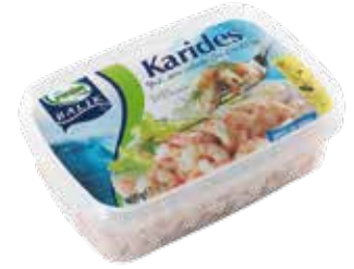
Karides 400 gr.