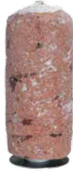
Döner Büfe 40 kg.