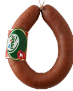
Sucuk Kangal Açık