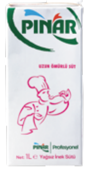
Yağsız Süt EDT 1/1 lt.