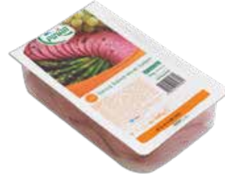
Salam Dilimli Servis 500 gr.