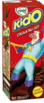
Kido Çikolatalı Süt 1/5 lt.