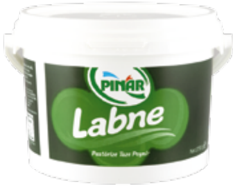
Labne 2.750 gr.