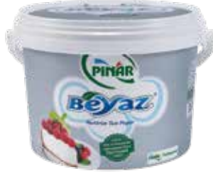
Pınar Beyaz 2.750 gr.