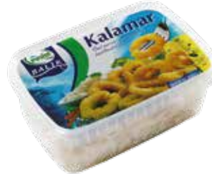
Halka Kalamar 400 gr.