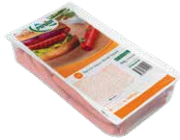
Sosis Uzun Servis 2.500 gr.