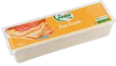
Büfe Kaşar Servis 2.000 gr.