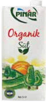
Süt Organik 1/1 Lt.