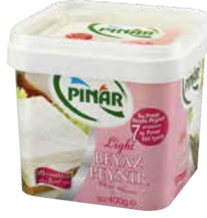
Beyaz Peynir Slm. Light 400 gr.