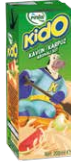
Kido Kavun - Karpuz Aromalı Süt 1/5 lt.