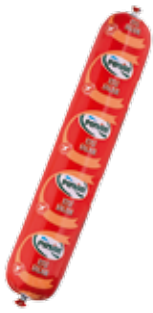
Salam Eti 1.250 gr.