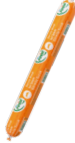
Sucuk Servis 500 gr.