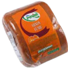
Füme Hindi Göğüs Açık Şarküteri