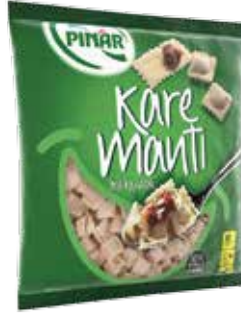
Kare Manti 400 gr.