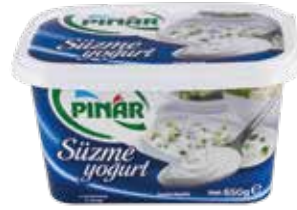
Yoğurt Süzme 650 gr.