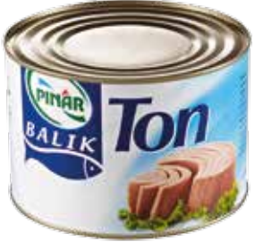
Ton Balık 1.705 gr.