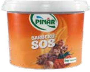
Barbekü Sos 2.500 gr.