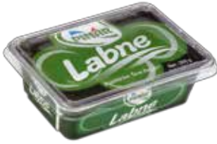
Labne 200 gr.