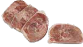
Hindi D. Mar. Osso-Bucco