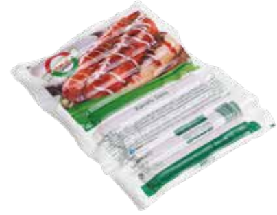
Sosis Yörük Catering 460 gr.