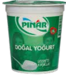
Yoğurt EDT 150 gr.