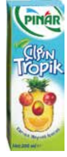
Çılgın Tropik 1/5 lt.