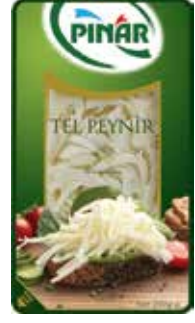
Tel Peyniri 200 gr.