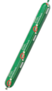
Sucuk Yörük Catering 500 gr.