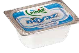
Pınar Beyaz 20 gr.